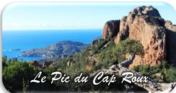
Le Pic du Cap Roux

En prévision Le Pic du Cap Roux dans l'Estérel et la visite de la grotte de Saint Honorat (facultatif)