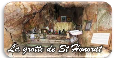
La grotte de St Honorat

Randonnée moyenne, 4h de marche, 5h avec l'ascension jusqu'à la grotte. Les personnes intéressées par cette randonnée voudront bien se faire connaître au secrétariat (04 93 20 83 95) afin que nous fixions une date qui conviendra à tout le monde, courant novembre.