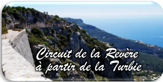
Circuit de la Revère à partir de la Turbie

Prochaine randonnée : le Circuit de la Revère à partir de la Turbie, randonnée facile, 150 à 200 m de dénivelée, 2h à 2h30 de marche. On pique nique sur place